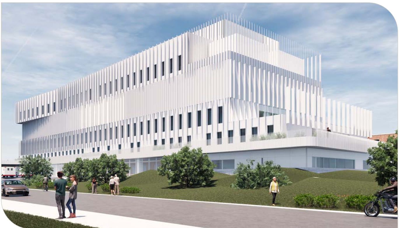
La nouvelle aile de l'Hôpital de Lachine sera terminée en 2026.