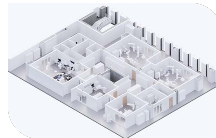
Rendu architectural du bloc opératoire de 6 salles.

Notre communauté attend depuis longtemps la concrétisation de ce projet, et nous, à la Fondation, allons faire de notre mieux pour vous tenir informés de son évolution. Nous sommes impatients de partager avec vous les étapes importantes de ce projet, et nous espérons pouvoir compter sur votre appui. ■