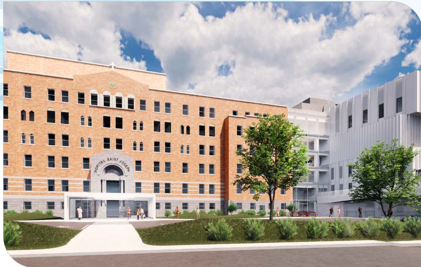
Vue de l'entrée principale de l'Hôpital sur la 16 e Avenue et de l'entrée de la nouvelle urgence.