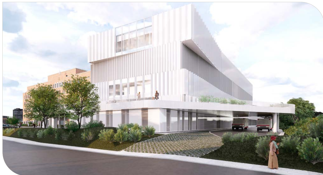
Vue de l'entrée des ambulances à l'angle de la 16 e Avenue et de la rue Saint-Antoine. La nouvelle aile abritera la nouvelle urgence, une unité de soins intensifs, des salles d'opération et une unité de soins palliatifs.