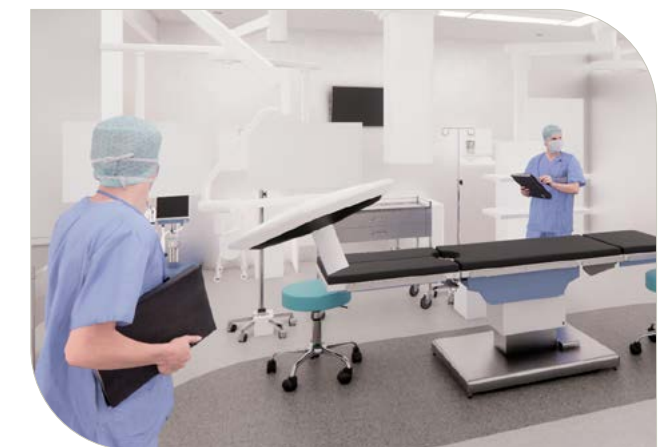
Rendu architectural de la salle de chirurgie bariatrique.