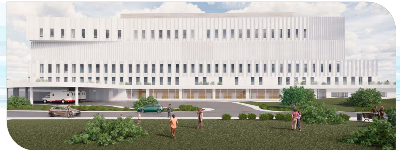
Façade nord de la nouvelle aile de l'Hôpital depuis le parc LaSalle (rue Saint-Antoine).

Comme sur le site Glen du CUSM, toutes les chambres sont conçues pour accueillir un seul patient, ce qui réduit considérablement le risque d'infection.